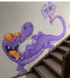
01 / Foto: Paul Hintermeier

in Karli17 – Karlingerstr. 17, 80992 München