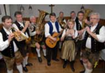
Kartenvorverkauf für „Bäff“ läuft bereits!

ab 12 Uhr Blechbriada und 18 - 22 Uhr Soundexpress