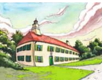
Illustration: Frank Cmucha

Zarte Aquarelle, spaßige Cartoons, verträumte Malereien, bissiger Humor, knallige Computergrafiken, stylische Comics und alles mögliche darüber und dazwischen.